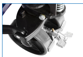
Bremse Varenr.: 8524800